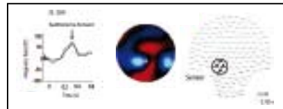
Darstellung einer Hirnantwort eines Feten in der 33. SSW nach ca. 300 ms nach dem Tonsignal: Die Sensoren in Nähe des Kindsköpfchens erfassen das Signal am stärksten, was als Magnetfeld-Dipol (rot-blaue Felder) im Sensorenfeld (Kreis links) zu