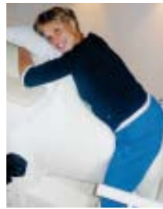
Eine Schwangere sitzt zur MEG-Aufzeichnung auf der an sie angepassten Sitzvorrichtung mit dem Bauch nach vorne gebeugt in die Sensorenschale.

Das Tübinger fMEG ist weltweit das zweite Gerät seiner Art. Um zwischen normaler und beeinträchtigter Hirn- und Herzentwicklung unterscheiden zu können, bedarf es einer großen Anzahl an Messungen, um Normwerte zu ermitteln. Diese Normwerte können mit Ergebnissen bei Schwangerschaften mit einer auffälligen Kindsentwicklung verglichen werden. Dazu laufen aktuell Untersuchungen im Rahmen von Studien. Leider können die Messergebnisse bislang nicht für Entscheidungen in Ihrer Schwangerschaft herangezogen werden. Sie helfen aber in Zukunft Risikoschwangerschaften besser zu betreuen.